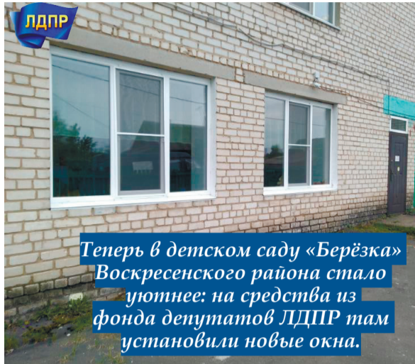
Теперь в детском саду «Берёзка» Воскресенского района стало уютнее: на средства из фонда депутатов ЛДПР там установили новые окна.

Весной 2021 года были выделены деньги из депутатского фонда и к осени в детском саду появились современные пластиковые окна. Руководство организации и родители воспитанников поблагодарили ЛДПР за помощь.