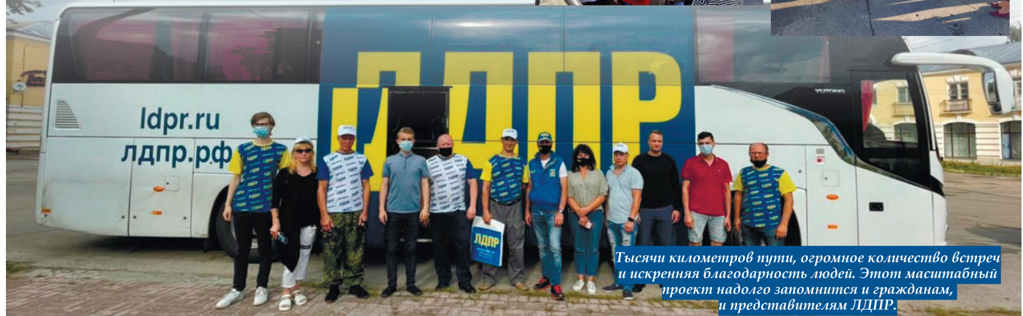
Тысячи километров пути, огромное количество встреч и искренняя благодарность людей. Этот масштабный проект надолго запомнится и гражданам, и представителям ЛДПР.