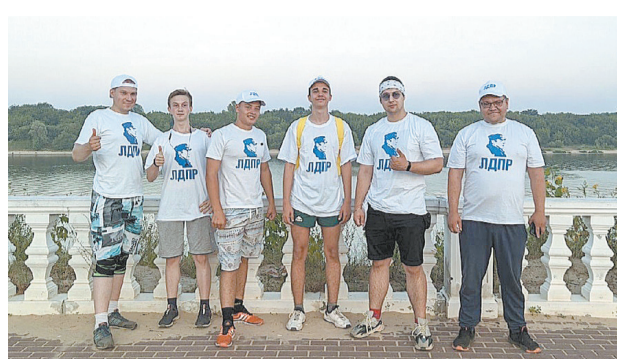
ЛДПР мотивирует заниматься спортом. Активисты Дзержинского местного отделения НРО ЛДПР организовали пробежку на набережной, чтобы показать горожанам положительный пример.