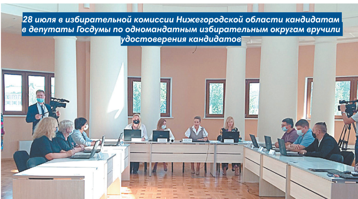
28 июля в избирательной комиссии Нижегородской области кандидатам в депутаты Госдумы по одномандатным избирательным округам вручили удостоверения кандидатов

Избирательная комиссия Нижегородской области вручила им удостоверения кандидатов.