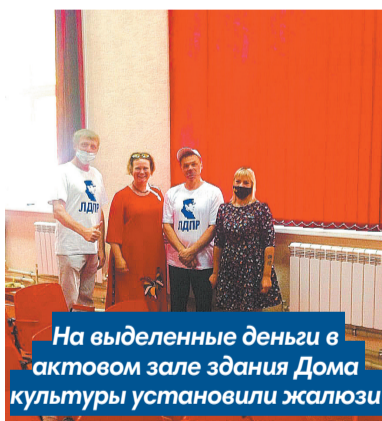
На выделенные деньги в актовом зале здания Дома культуры установили жалюзи

чил Дом культуры поселка Центральный Богородского района. На выделенные деньги в актовом зале здания установили жалюзи.