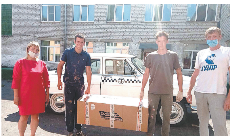
Благодаря депутатам ЛДПР в Доскинской и саровских школах появился комплекс «Юный пешеход». На нем дети смогут научиться поведению на дороге